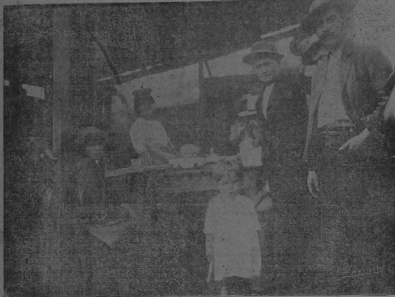
En un rincón de la Plaza del Ganado se improvisa un restaurant.

Uno de los espectáculos típicos de esta capital es el Mercado de Ganado. Es una especie de pequeña feria, sin pretensiones, que se verifica cada sábado en la mañana. El local está allá en el extremo suroeste de la capital: es una plaza amplia rodeada de muros. Al centro un galero; un shrevadero a la izquierda y al fondo un chuchulo sucio y feo donde hozan los cerdos y escarban las gallinas; a la derecha en una esquina, un cobertizo medio arruinado donde cada día se improvisa una hostería, en la cual los tratantes echan un remiendo al estómago. Tal el escenario. Las escenas son muy heterocéneas y variadas.