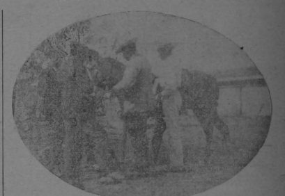
Otra escena en la Plaza de Ganado.