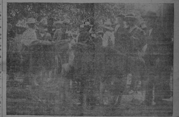
Examinando un caballo.