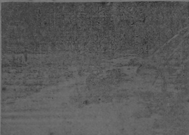
Río Siquirres, de donde se tomará el agua para la cafetería de la población de la Línea que lleva aquel mismo nombre.