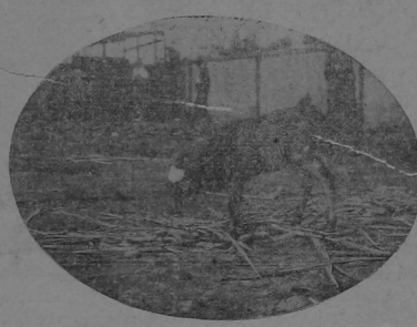
Un ternero flaco y hambriento que pronto será víctima de la cuchilla del matanís.